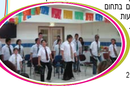
תלמידי בי"ס קורצ'ק פ"ת, במופע תנועה בפני באי האסיפה

השנה תתקיים האסיפה במועד מוקדם יותר, בסוף חודש מאי 2009 באשקלון.