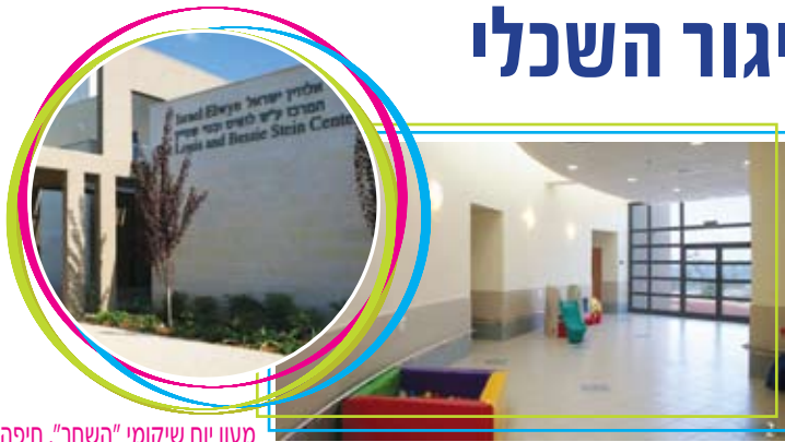
מעון יום שיקומי "השחר", חיפה