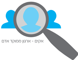
אקים - ארגון ממוקד אדם

בהתאם לחזונו מקדם הארגון הטמעת עמדות חיוביות כלפי אנשים עם מוגבלות שכלית. ומבצע זאת באמצעות מטה אקים, ובאמצעות 64 סניפים ומוקדי פעילות הפרוסים ב-82 ישובים ברחבי הארץ במגזר היהודי ובמגזר הערבי, שאותם מנהלים הורים ומתנדבים.