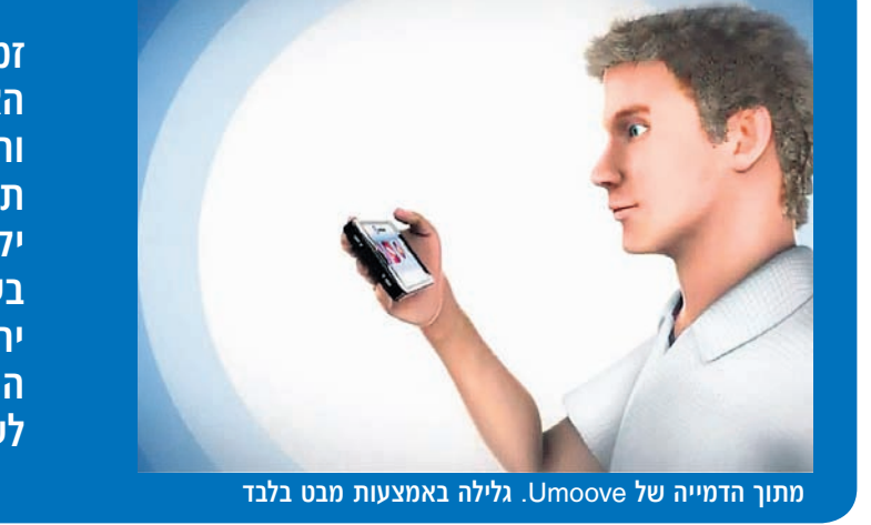
מתוך הדמייה של iUmooove. גליה באמצעות מבט בלבד

העורה הממוחשבת לבעלי מוגבלויות מגיעה מכיוונים נוספים, לא רק ממוצרי של טימוקו (Timocco) הוא סטארט־אפ ותיק יחסית בתחום, שפיתח ידיו רק כטווח כתפיו, לשחק על כל המסך