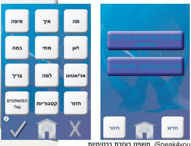
iSpeak4You. משפט בעזרת כרטיסיות