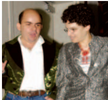
צמד המנחים בני דולי בדרכם לבמה.

(אנו מביאים את הסיפור בפניכם, כי בעינינו זה דיאלוג מרגש וכמו שאמר... "כל המרבה הרי זה משובח!")