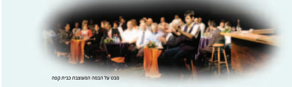
מבט על הבמה המעוצבת כבית קפה