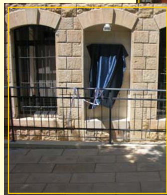
הוסטל "דרור" בצפת