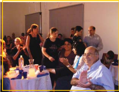
שחקני ההצגה "קפה הפוך" בעפולה ביום העיון