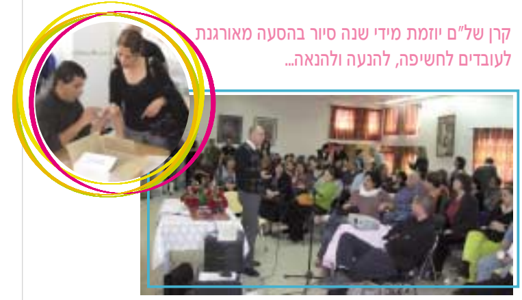
קרן של"ם יוזמת מידי שנה סיור בהסעה מאורגנת לעובדים לחשיפה, להנעה ולהנאה...

מסורת בקרן של"ם - "יום סיור נוסע" לעובדים בתחום הטיפול באדם עם הפיגור השכלי למפגש עמיתים ולהחלפת מידעים בתחום מכל המסגרות בארץ, יום שהוא כולו למען העוסקים במלאכה. השנה התקיים יום הסיור בדרום הארץ, בדגש על חשיפת מסגרות תעסוקה חדשות, ובמהלכו נחשפו כמאה איש מכל רחבי הארץ המשתתפים לתחום התעסוקה, תוך דגש על מסגרות שנמצאות בשלבי פיתוח. המשתתפים סיירו במע"ש יחדיו באר שבע, במערך דיור "בית כהן" בבאר שבע ובמרכזי תעסוקה רב נכתיים בכסייפה ודימונה.