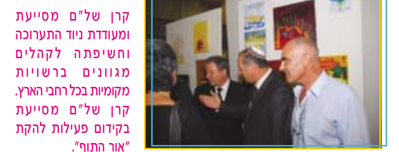
קרן של"ם מסייעת ומעודדת ניווד התערוכה וחשיפת לקהלים מגוונים ברשויות מקומיות בכל רחבי הארץ. קרן של"ם מסייעת בקידום פעילות להקת "אור התוף".