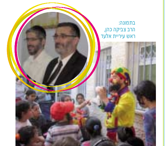
בתמונה: הרב צביקה כהן, ראש עיריית אלעד

קרן של"ם סייעה במענק של 120,000 ש"ח לציוד פנים וחצר להפעלת המשחקיה.