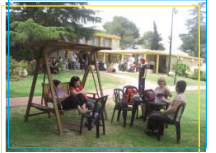
קרן של"ם סייעה בקיום ההשתלמות.