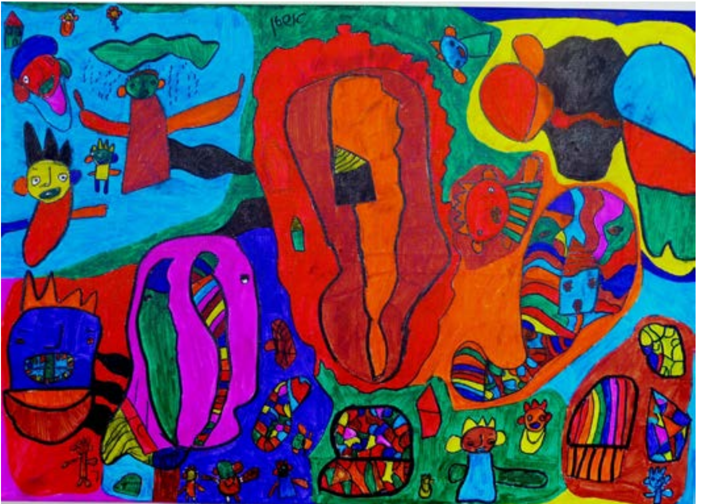
אמן: אשטו טנג'יי. שם היצירה: דברים טובים ויפים.