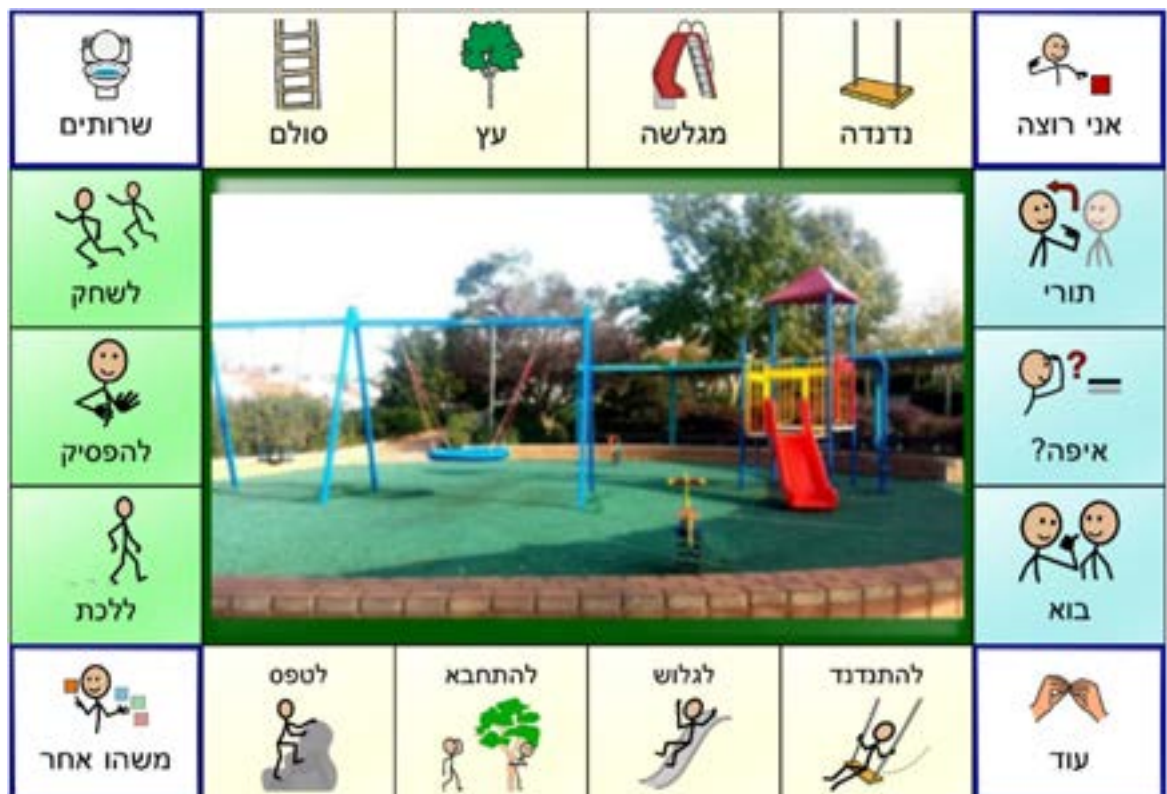
(מומלץ לתלות את הלוח בקרבת גן השעשועים)