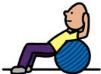
משחק עם כדור